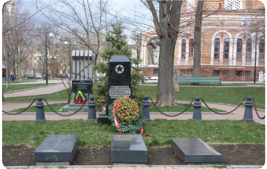
Братское захоронение 1500 советских граждан

На автобусе № 16 возвращаемся в центр города, выходим на конечной остановке и прогулочным шагом поднимаемся на улицу Пушкинскую к братскому захоронению 1500 советских граждан, мирных жителей Ростова, расстрелянных фашистскими оккупантами в 1943 году. На обелиске выбита пятиконечная звезда и текст: «Здесь похоронены Советские патриоты, зверски замученные фашистскими палачами в феврале