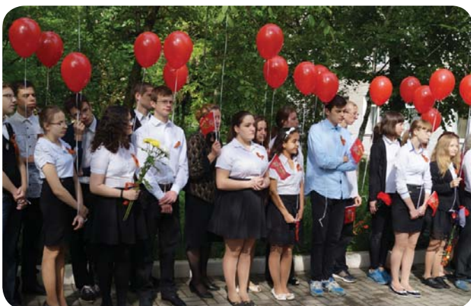
На общешкольной линейке