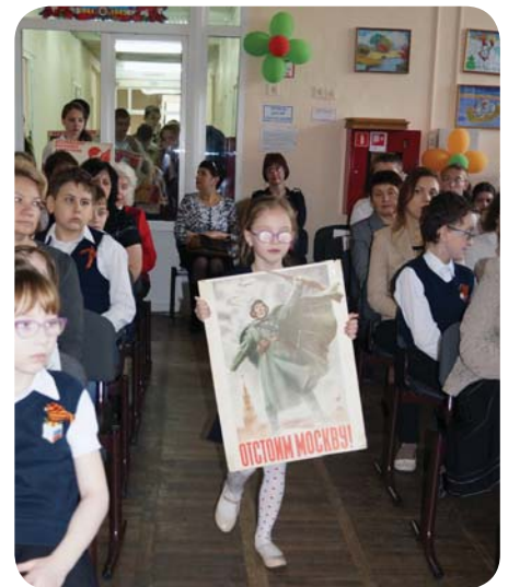
Плакат «Отстоим Москву!»