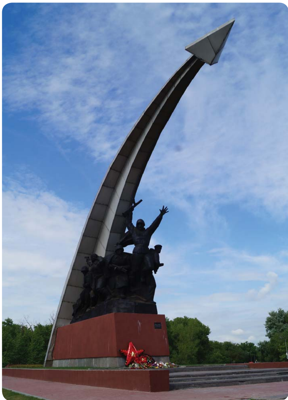
Монумент «Штурм» в Кумженской роще

На отесанном гранитном камне надпись: «Пройдут десятилетия, но к памятникам воинской доблести будут приходить внуки и правнуки героев, здесь люди вновь и вновь в памяти своей будут обращаться к бесмертному подвигу советского солдата, большой кровью от-