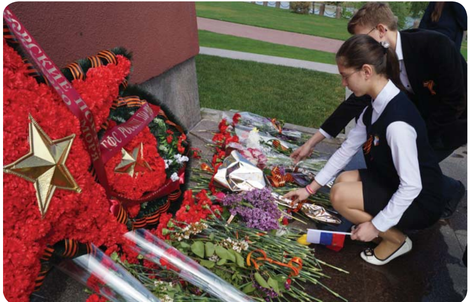
У памятника «Штурм» в Кумженской роще

О начале праздника в 9.00 возвестили звуки фанфар. Стихи, песни военной тематики... Ребята и взрослые изо всех сил старались, общешкольная линейка прошла очень торжественно и трогательно. Прямо с линейки делегация лучших