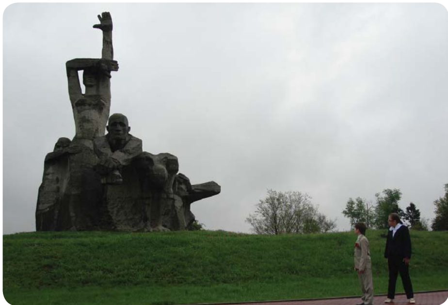
Мемориальный комплекс «Памяти жертв фашизма»

В балке царит тишина. Жуткая, пробирающая до мозга костей. Гробовая. В нескольких метрах пролегает оживленная магистраль, туда-сюда непрерывно снуют машины. Но стоит спуститься по каменной лестнице, ступить на эту полную человеческого горя и отчаяния землю, весь шум куда-то исчезает. Неотрывно на тебя, мимо тебя, через тебя смотрят страш-